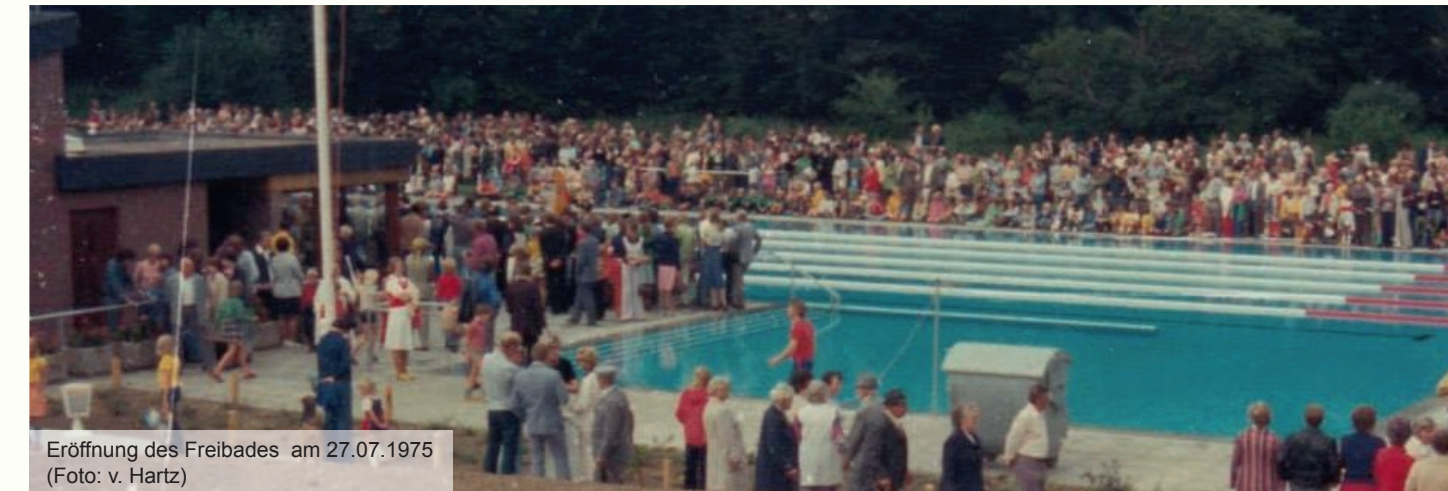
Eröffnung des Freibades am 27.07.1975

Offizielle Mitteilungen und Informationen der Gemeinde Trittau