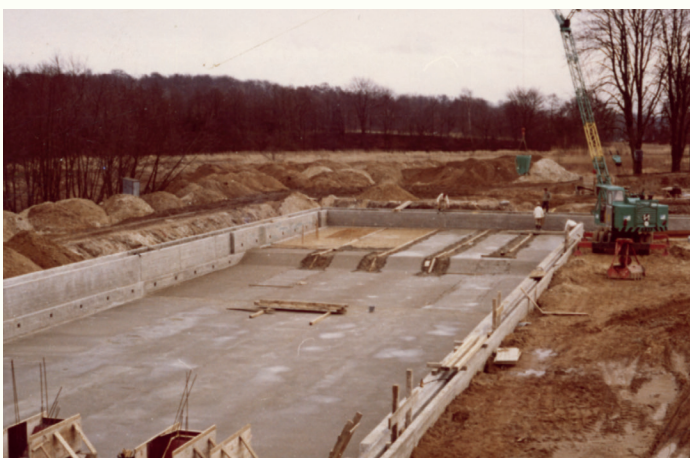
Erster Bauabschnitt im Herbst 1974

Dass in Trittau überhaupt ein Freibad gebaut werden konnte, geht auf engagierte Bürgerinnen und Bürger zurück. Schon 1969 gründeten sie einen Förderverein, um dem Wunsch der Trittauerinnen und Trittauer nach einem Schwimmbad eine Stimme zu verleihen und Gelder zusammen zu tragen. Sechs Jahre später war es dann soweit: Im August 1974 wurde mit dem Bau begonnen und am 27. Juli 1975 konnte der erste Bauabschnitt mit einem Volksfest eingeweiht werden.