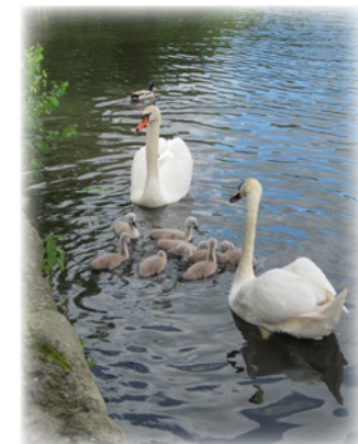
Foto des Monats Juni 2017 von Hans-Dieter Schmoll „Mühlenteich mit Schwanenfamilie“

Die ausführlichen Teilnahmebedingungen sowie die notwendigen Einverständniserklärungen finden Sie auf der Homepage der Gemeinde Trittau unter http://www.trittau.de/pages/die-gemeinde/850-jahre-trittau---tradition-verbindet/fotowettbewerb.php