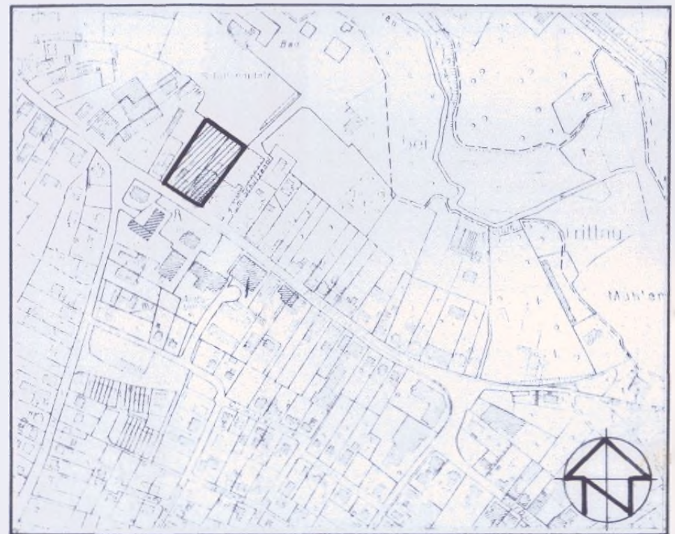
ÜBERSICHTSPLAN M 1:25000

Aufgrund des § 10 des Baugesetzbuches (BauGB) in der Fassung vom 8. Dezember 1986 (BGBl. I S. 2253), zuletzt geändert durch Gesetz vom 22. April 1993 (BGBl. I S. 466), sowie nach § 82 der Landesbauordnung (LBO) vom 24. Februar 1983 (GVBl. Schl.-H. S. 86), wird nach Beschlußfassung durch die Gemeindevertretung vom 9. September 1993 und mit Genehmigung des Landrates des Kreises Stormarn und nach Durchführung des Anzeigeverfahrens beim Landrat des Kreises Stormarn folgende Satzung über die 1. Änderung des Bebauungsplanes Nr. 22a für das Gebiet nördlich der Poststraße, südwestlich des Schützenplatzes, bestehend aus der Planzeichnung (Teil A) und dem Text (Teil B), erlassen: